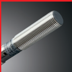
Sensortechnik – Kompakte Intelligenz