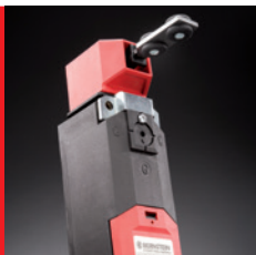
Schaltertechnik – Wirtschaftlichkeit trifft Sicherheit