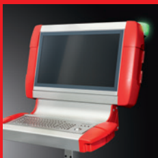
Gehäusetechnik – Funktion und Design